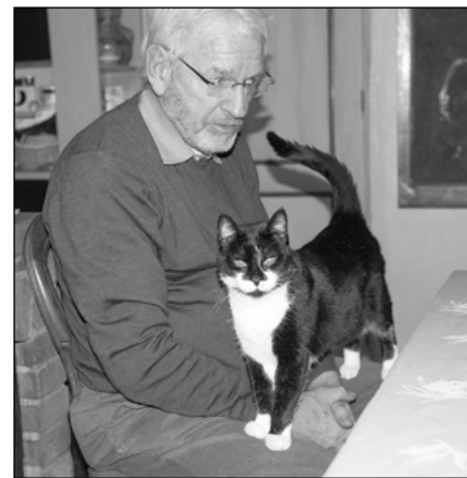
... avec le chat

L'objection est qu'aujourd'hui on ne vit plus ainsi, donc pourquoi continuer ? À mon sens,