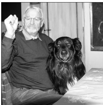
Vie à la campagne avec le chien

À la Colle-sur-Loup, c'était des stages privés.